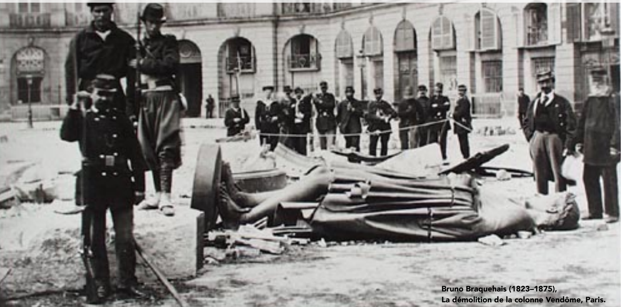
Bruno Braquehais (1823–1875), La démolition de la colonne Vendôme, Paris.