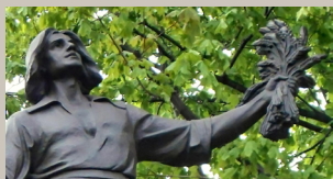
Monument Louis Hébert, premier colon du Canada.

C'est ici à Québec le 4 juillet 1617, que la première famille française est arrivée. Nous voici en 2017, prêts à célébrer le 400 e anniversaire de l'arrivée de Louis Hébert, de Marie Rollet et de leurs trois enfants en Nouvelle-France.