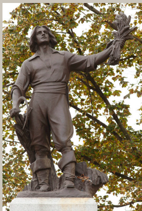
Monument Louis Hébert

Un parcours pédestre Sur les traces de Louis Hébert et de Marie Rollet met en valeur l'histoire de la famille pionnière en la localisant dans ses différents lieux de vie. Il permet de découvrir, entre autres, le monument dévoilé en 1918, puis reconstitué en 1977 sur l'emplacement qui a fait partie des propriétés de Louis Hébert. Le lancement aura lieu le 31 mai prochain à 17 h au pavillon Alphonse-Desjardins, salle Hydro-Québec, Université Laval. Offert par la Société historique de Québec.