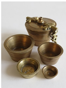
Poids en godet MUSÉE DES AUGUSTINES