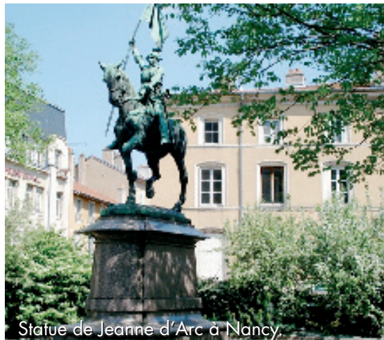
Statue de Jeanne d'Arc à Nancy.

Depuis Gérardmer, il est facile de rejoindre le point de départ du circuit de la Champagne du Sud. En effet Langres, ville natale d'une autre Jeanne, Jeanne Mance, cofondatrice de Montréal, se situe à 100 km.