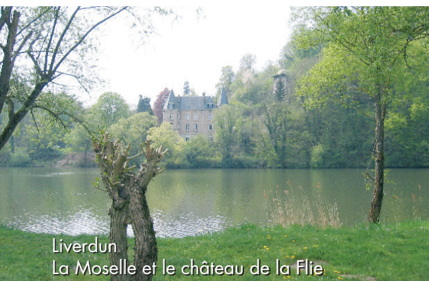
Liverdu La Moselle et le château de la Flie

Références : Carte Michelin N°516 Alsace-Lorraine, au 1/200000.