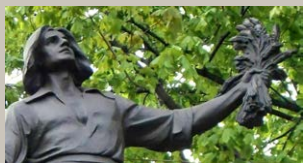
Monument Louis Hébert, premier colon du Canada.

C'est ici à Québec le 4 juillet 1617, que la première famille française est arrivée. Nous voici en 2017, prêts à célébrer le 400 e anniversaire de l'arrivée de Louis Hébert, de Marie Rollet et de leurs trois enfants en Nouvelle-France.