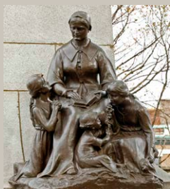
Marie Rollet et ses enfants, du sculpteur Alfred Laliberté pour le monument de Louis Hébert, à Québec, en 1918.

Louis Hébert se distingue sous plusieurs dimensions: premier agriculteur français, apothicaire et botaniste, dont les plantes envoyées à Paris gagneront rapidement toute l'Europe. Marie Rollet, pour sa part, apporta un grand soin à l'éducation de leurs enfants et des jeunes Amérindiennes qui le souhaitaient.