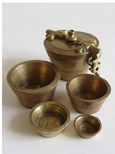
Poids en godet MUSÉE DES AUGUSTINES