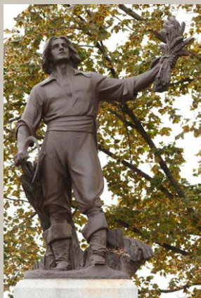
Monument Louis Hébert

Un parcours pédestre Sur les traces de Louis Hébert et de Marie Rollet met en valeur l'histoire de la famille pionnière en la localisant dans ses différents lieux de vie. Il permet de découvrir, entre autres, le monument dévoilé en 1918, puis reconstitué en 1977 sur l'emplacement qui a fait partie des propriétés de Louis Hébert. Le lancement aura lieu le 31 mai prochain à 17 h au pavillon Alphonse-Desjardins, salle Hydro-Québec, Université Laval. Offert par la Société historique de Québec.