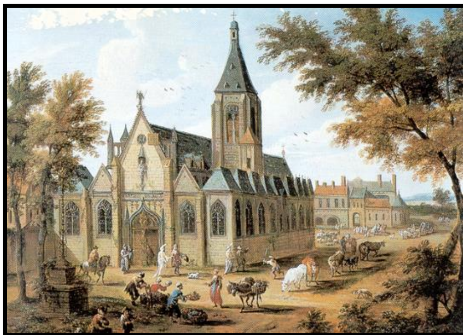
L'église Saint-Sulpice de Paris en 1601

Source : Registre de la paroisse de Saint-Sulpice de Paris, Archives nationales de France, cote LL958 Folio X, recto. Acte dans Internet : http://www.geneanet.org/archives/registres/view/5602 Recherches : Gilles Brassard, Paris, 2016. Paléographie : Claire Dolan et Josée Tétreault, 2017.