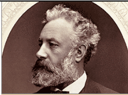
Portrait de Jules Verne Adam Salomon, 1877