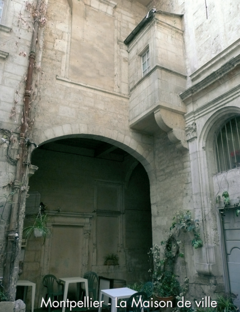
Montpellier - La Maison de ville