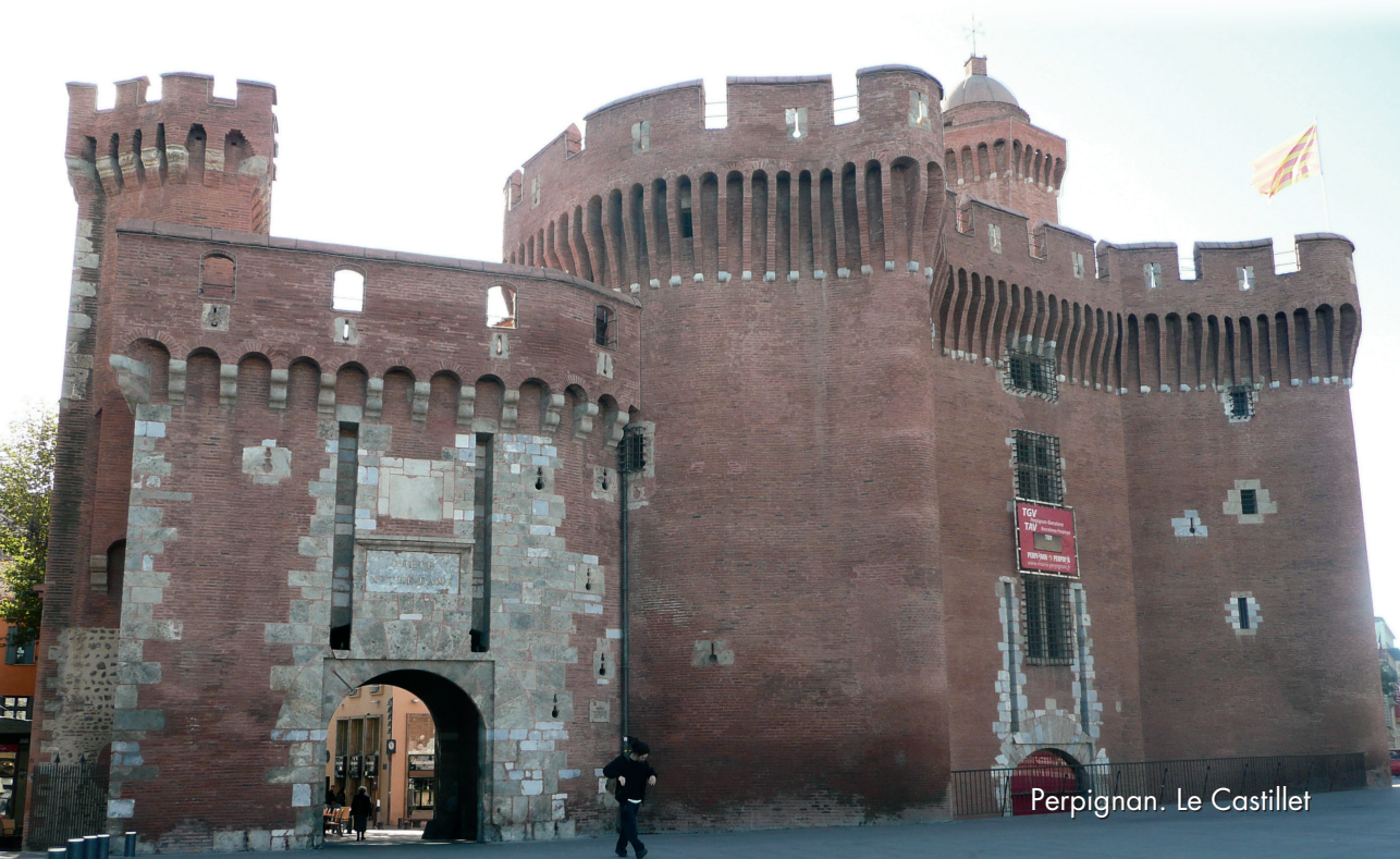
Perpignan. Le Castillet