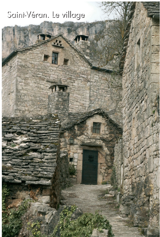
Saint-Véran. Le village

Référence : Carte Régionale IGN R17 Languedoc-Roussillon. 1/250 000.