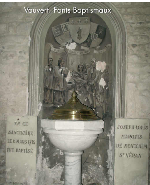
Vauvert. Fonts Baptismaux

Dans la petite Eglise, au centre du village on pourra découvrir à l'intérieur, les fonts baptismaux avec plaques commémoratives rappelant aux visiteurs qu'en ces Lieux, le 6 mars 1712, Louis-Joseph de St Véran, marquis de Montcalm, a été baptisé.