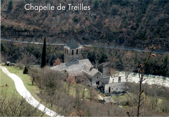
Chapelle de Treilles