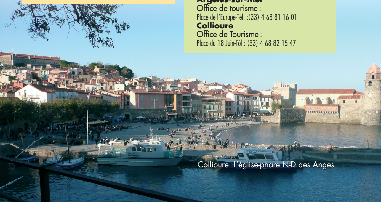
Collioure. L'église-phare N-D des Anges

Place du 18 Juin-Tél. : (33) 4 68 82 15 47