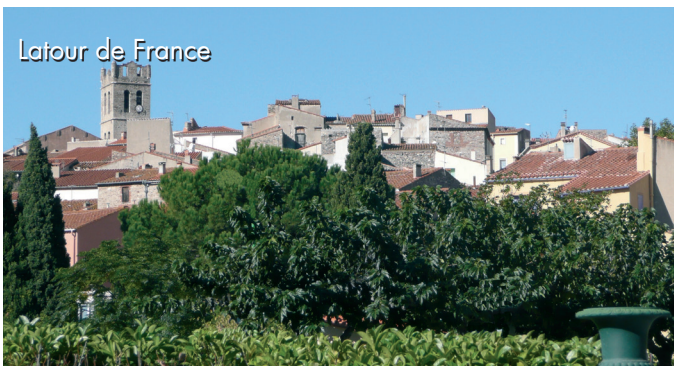
Latour de France

C'est en partant de Perpignan, depuis le Castillet haut lieu de mémoire des Catalans, à travers la chaîne des Fenouillèdes, le Massif du Canigou et la vallée du Vallespir que nous allons découvrir ces villages, points de départ de ces intrépides soldats. Routes tourmentées, paysages grandioses et rudes, hameaux perdus dans la nature sauvage, loin de toute agitation trépidante des grandes villes.