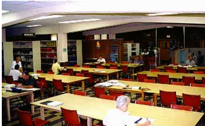
MAISON DE LA GÉNÉALOGIE de la Société généalogique canadienne française