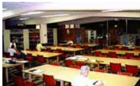
MAISON DE LA GÉNÉALOGIE de la Société généalogique canadienne française